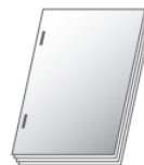
Blocs Agrafage à plat sur la longueur de la liasse