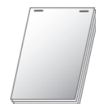
Blocs Agrafage à plat sur la largeur de la liasse

Pour tout renseignement complémentaire, n'hésitez pas à nous contacter.