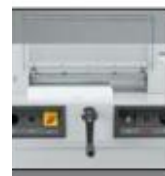
Carter de protection avant