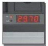
Affichage digital des dimensions

Pour tout renseignement complémentaire, n'hésitez pas à nous contacter.