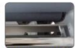
Barre de détuilage