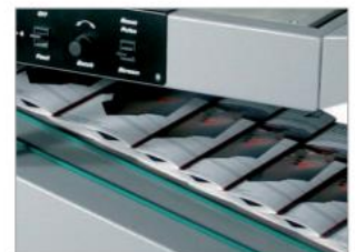
Sortie motorisée en nappe à l'avant de la machine.