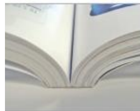
Un dos carré collé de haute qualité et très résistant.