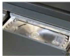
Fraisage des documents pour une meilleure pénétration de la colle.