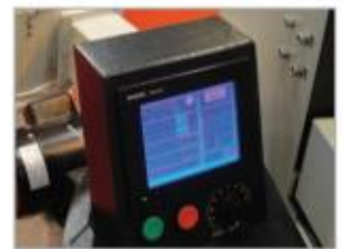
Grand écran de commande tactile très simple d'utilisation.

Pour tout renseignement complémentaire, n'hésitez pas à nous contacter.