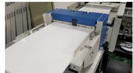
Alimentation automatique des couvertures