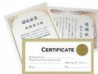
Diplômes Scolaires et Certificats

Vitesse Maximum: jusqu'à 10 A4 /minute Format Papier maximum : 297 mm x 420 mm Format Papier minimum : 210 mm x 148 mm Largeur maximum : 315 mm Longueur maximum: 600 mm Principe: Rouleaux chauffants (température ajustable) Grammage: 110gsm — 350gsm Alimentation: Manuelle Consommables: Rouleaux Exclusifs (largeur 320 mm) Alimentation : 230V – 50/60 Hz - 600V Dimensions : L 300 x P 450 x H 270