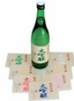
Étiquettes et cartes de visites