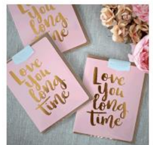
Cartes de vœux

Pour tout renseignement complémentaire, n'hésitez pas à nous contacter.